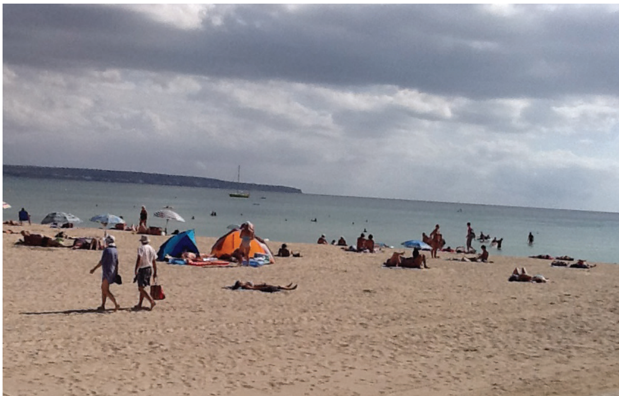
Me kosar oss i syden.