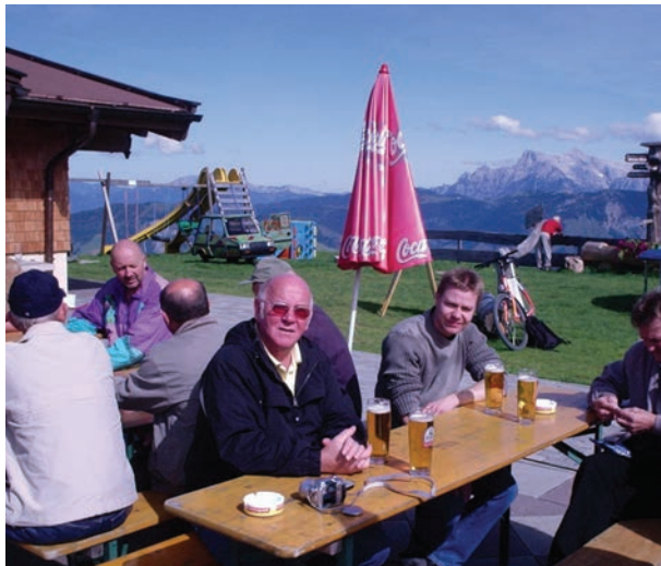
Høgt til fjells.