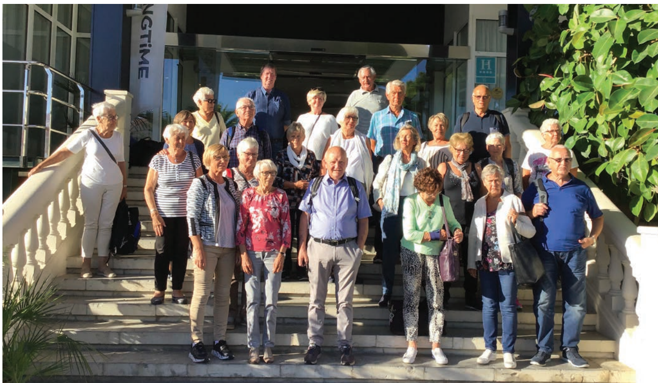
Medlemmer klare til utflukt på Mallorca.

Stord LHL har reist på cruise til middelhavel. Her har me besøkt Tunisia og Roma- der me var i Vatikanet med dyktige guider. Me var i Villefranche i Frankrike, og Barcelona med flott sightseeing. Etter dette gikk turen tilbake til Mallorca og vart avslutta med ei veke på Alcudia.