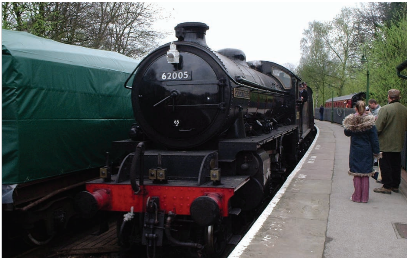
Ein gammal travar

Me har også rreist til Færøyane. Der leigde me flyet som til vanleg vart i bruk som transport for Aker Stord sine tilsette, som pendla. Der var me i 5 dagar, i stille ver og fekk oppleva kor nært knytta Noreg og Færøyane er.