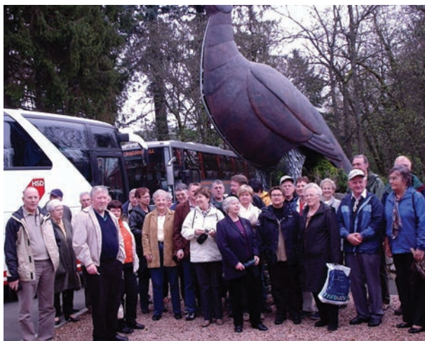
På besøk i destilleriet The Famous Grouse.