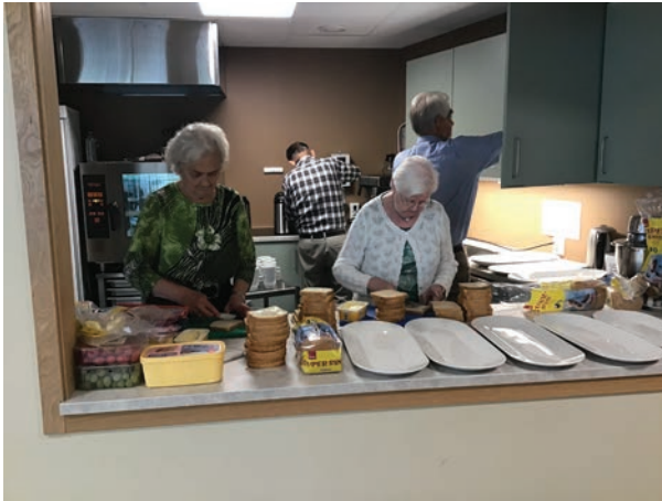
Kjøkkengiengen i arbeid.