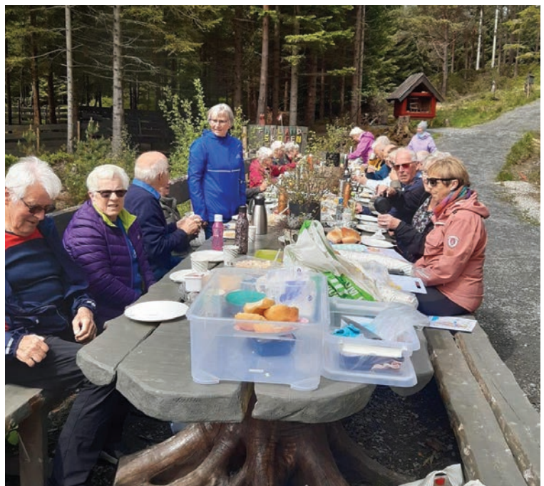
Hatlandsskogen på Halsnøy