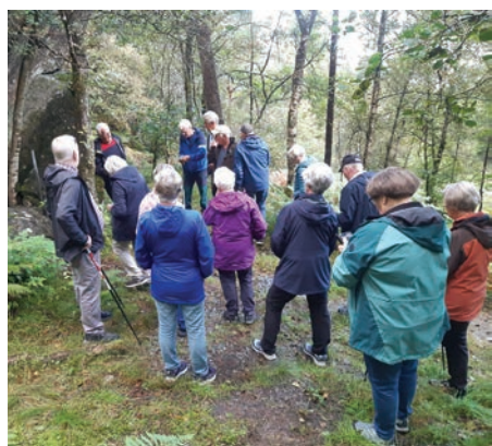
Radiohola på Halsnøy