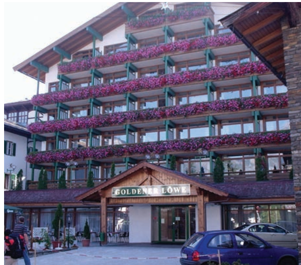
Fint pynta hotell.