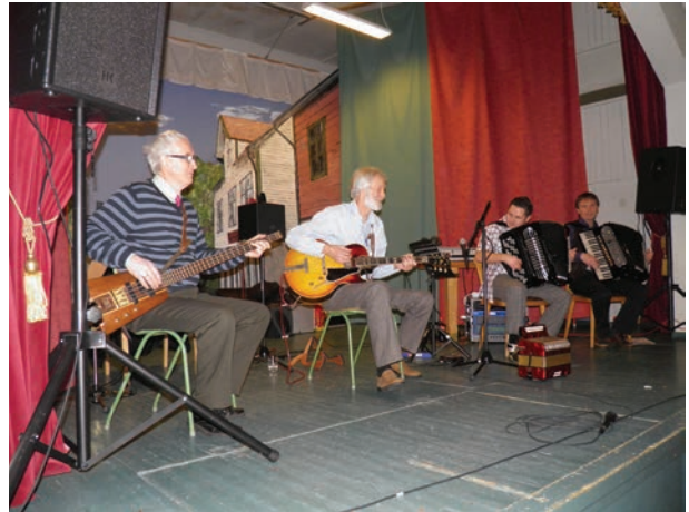
Underholdning på medlemsmøta.