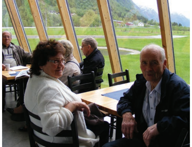
Blåtur til bremuseet.