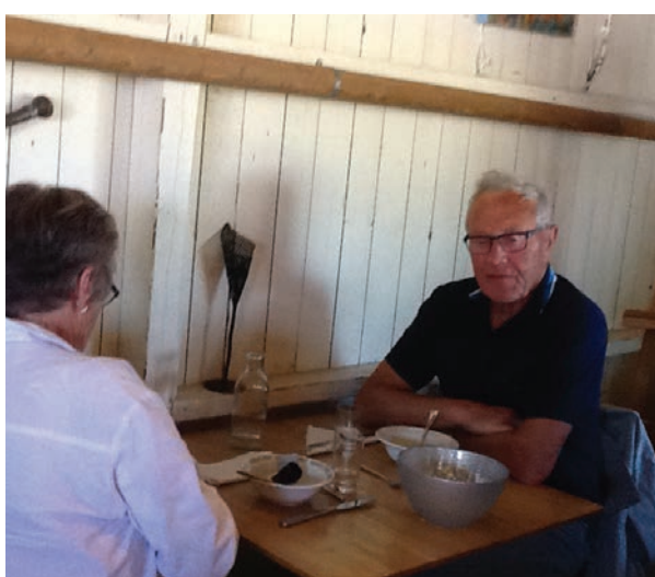
Søndagsutflukt under pandemien