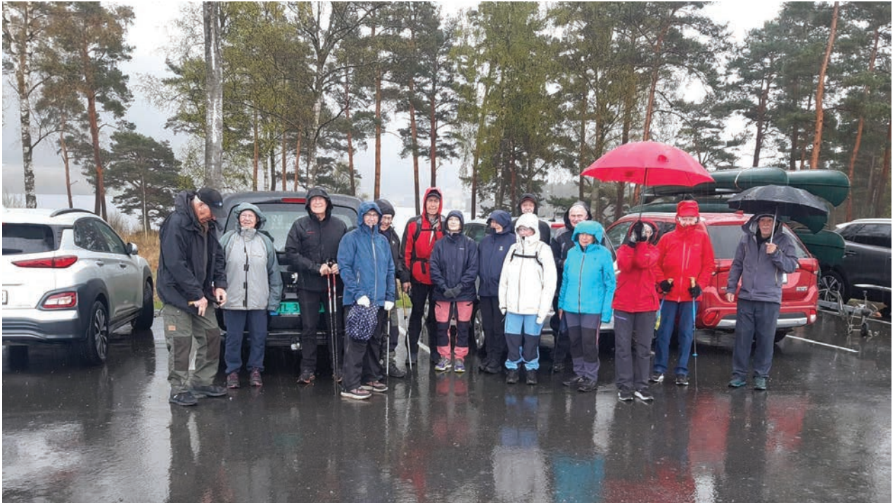
Ut på tur aldri sur