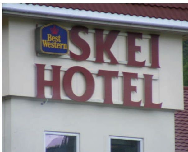
Blátur til Skei hotell.