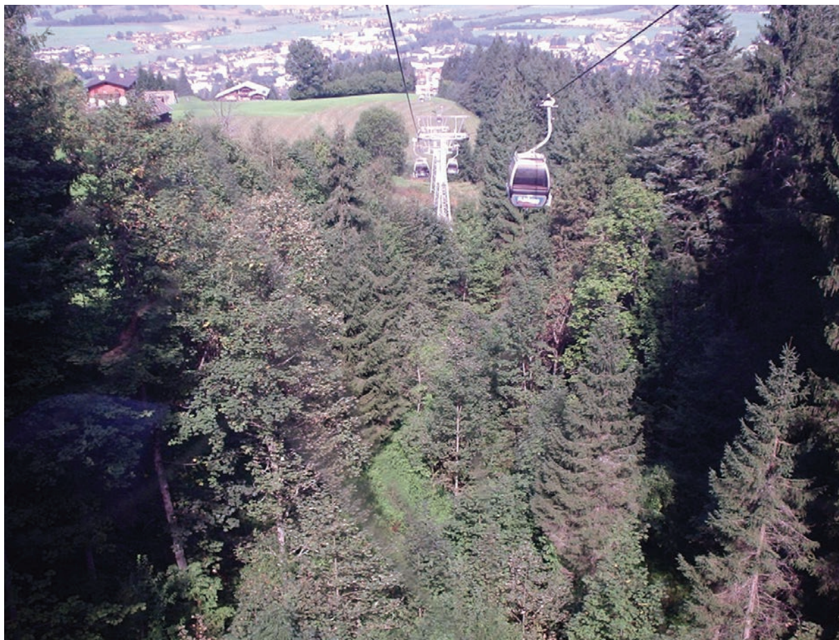
Taubanen i San Juan.

Me har og vert i Austerrike på Knødel festival ,ein fin tur gjennom Europa ,og mange utflukter frå San Juan der me budde. Fantastisk å få oppleve Tyrol fra ein bekvem turbuss.