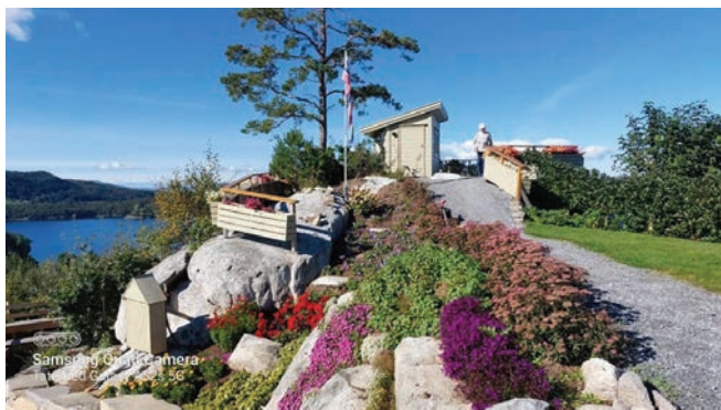
Fatlandsskogen på Halsnøy