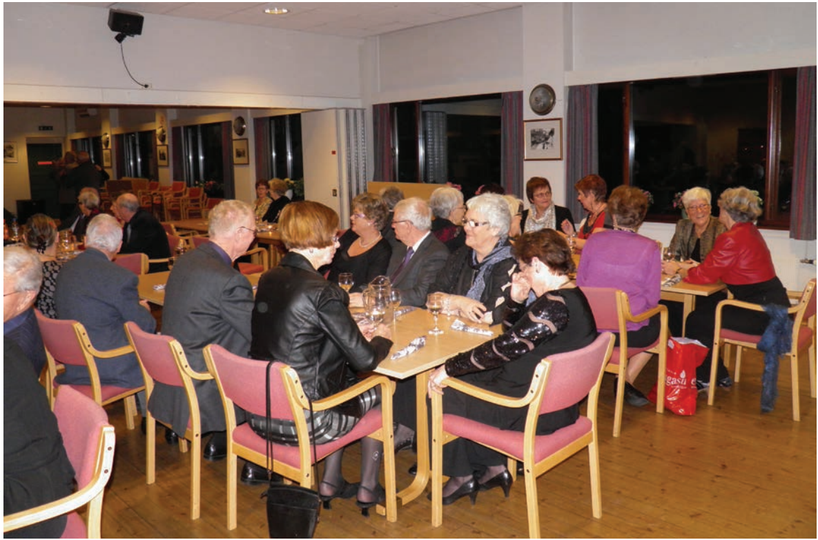
Dansekveld i Turnhallen