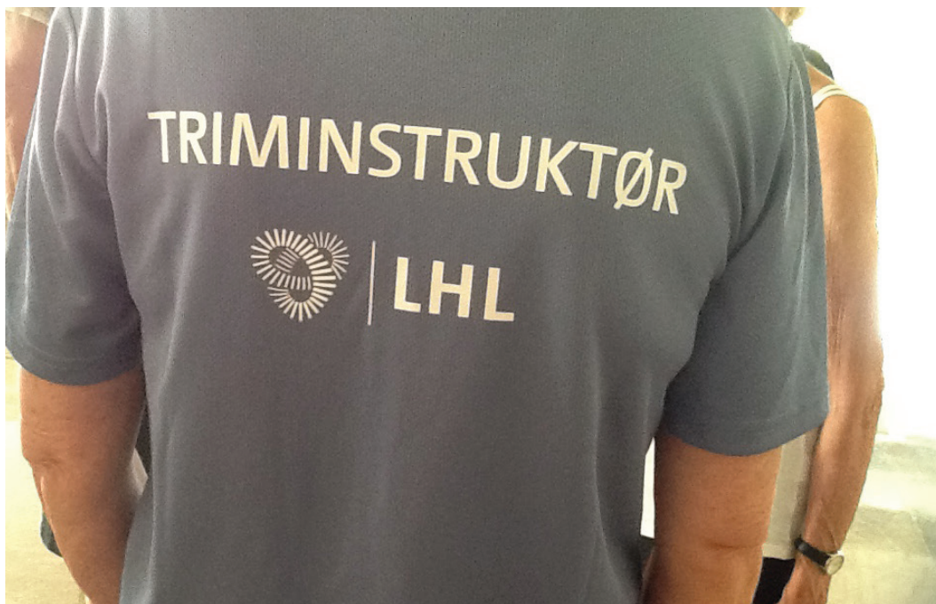
Instruktøren er godt merka