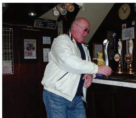
Dåværande leiar på puben i Aidensfield.