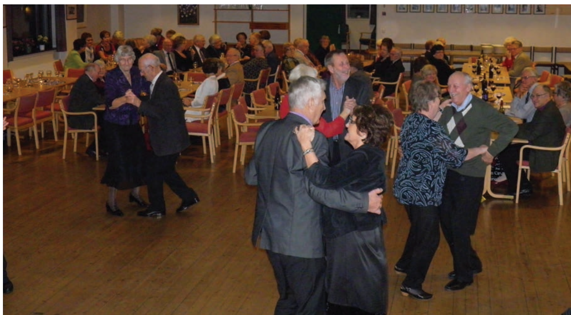
Danseskjeld i Turnhallen