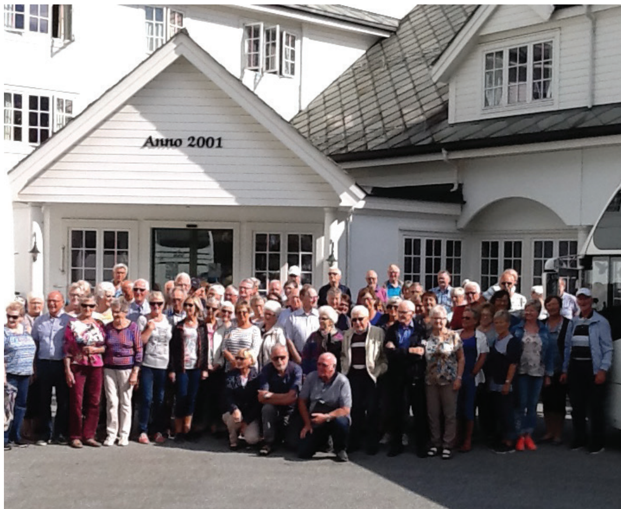
Blåtur til nedre Eidfjord.