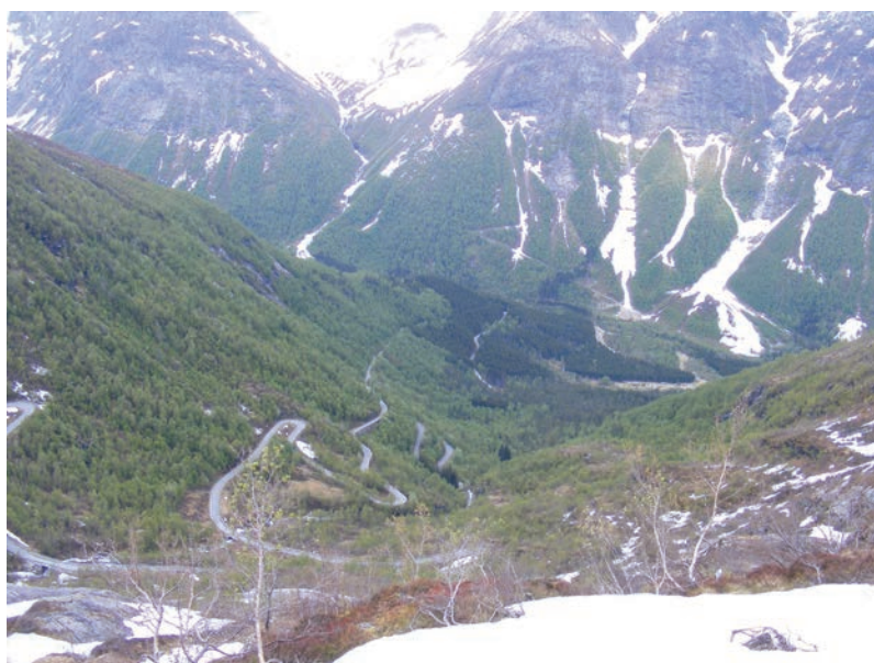
Blåtur til bremuseet.