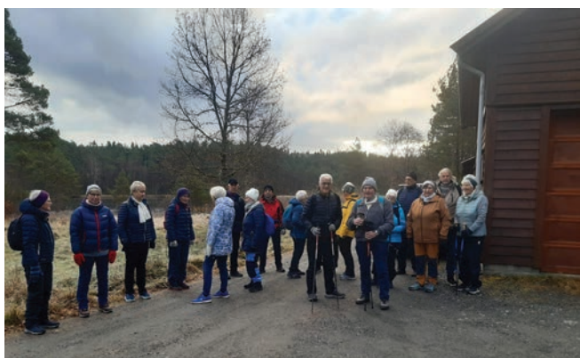
Tur til Valevåg