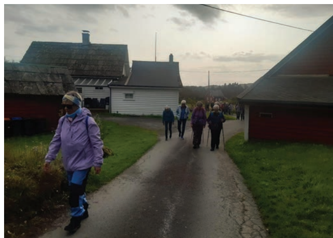
Tur til Røvær