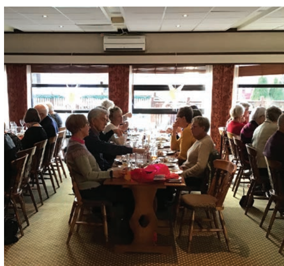
Søndagsutflukt under pandemien