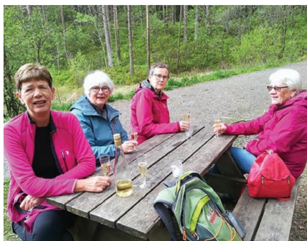
Ein del av damegruppa