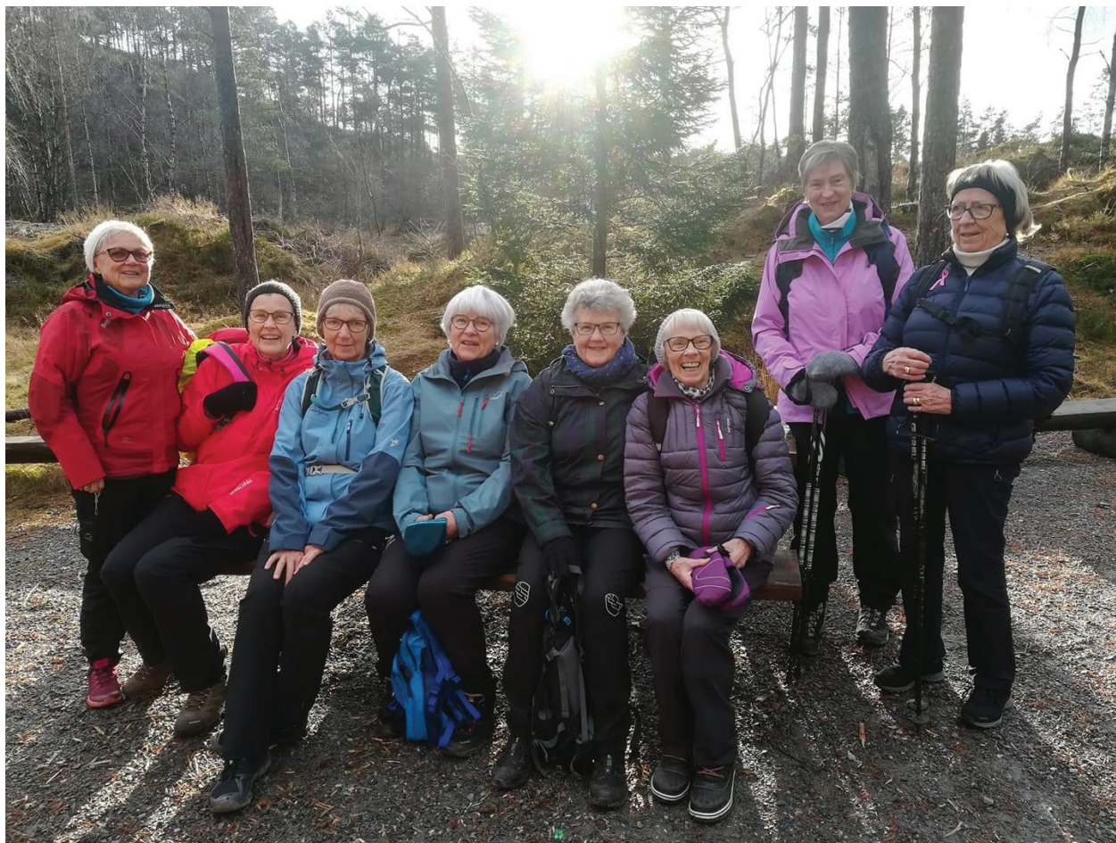
Damer på tur, på ein av sine mange turar