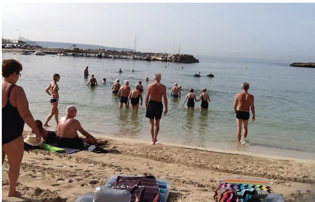
Bading/Trim på Mallorca.