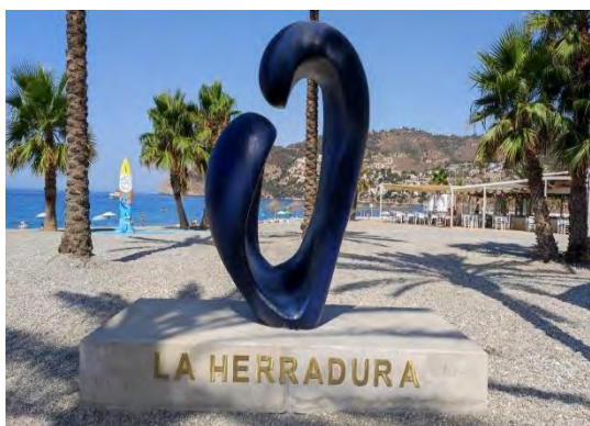
Stranda i Almuñecar

Vi gjør oppmerksom på at assistanse gjelder fra innsjekk på avreiseflyplass til bagasjeband på ankomstflyplass.