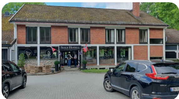
Del av bygningsmassen på gjestegården