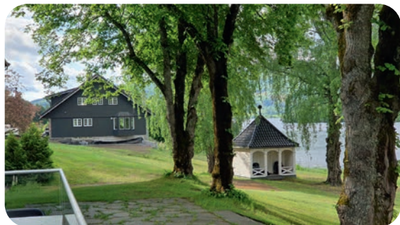
Bolighus og lysthus med Krøderen i bakgrunnen

og deklamere diktet Fanitullen av Jørgen Moe på en glimrende måte under middagen. Stor applaus fra forsamlingen, og en minneverdig opplevelse. Og som Svein Olav Tovsrud skriver i sin statusrapport fra LHL Buskerud, det planlegges en ny lagsamling i oktober 2024 på Lampeland hotell. Så følg med annonsering av dette i Bladet Vårt nr. 3/2024 i september.