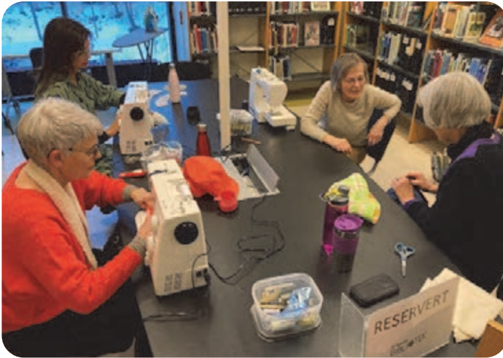
Syverksted. Biblioteket låner ut 5 symaskiner. Her sys det bøtthatter.

lokaler. Vi stoppet ved utlåns-automatene for å vise hvordan de fungerer, ved Frøbiblioteket, for å vise hvordan man som innbygger kan komme å låne frø helt gratis. Før vi svei-