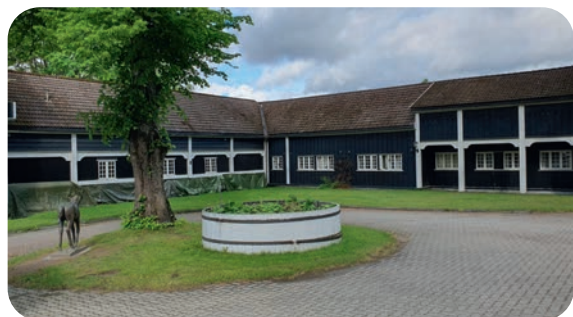
Del av bygningsmassen på gjestegården

Jeg ønsket også å få et inntrykk av data-opplæringen som ble gitt (siden jeg er datamann selv). Og deltakerne på lagsmøtet ble ikke skuffet (tror jeg). De virket ihvertfall veldig ivrig underveis og også veldig fornøyd etter endt lagsmøte. Det var nesten slik at man ikke hadde tid til å ta pauser. Både innkvarteringen, møterommet og serveringen ved Sole Gjestegård var meget bra.