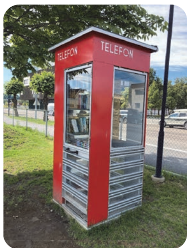
Lesekiosk nr. 112, åpnet høsten 2022.

På ei lita kveldsøkt er det begrenset med tid, men flere av bibliotekets digitale tilbud og apper ble presentert. Etter foredraget ble alle med på en liten omvisning i bibliotekets