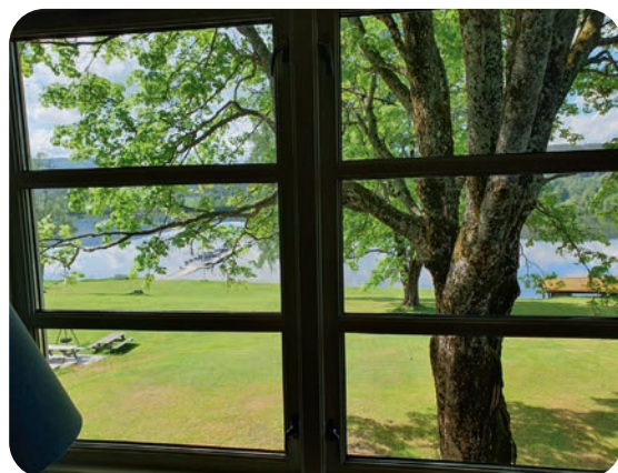
Utsikt fra møterommet