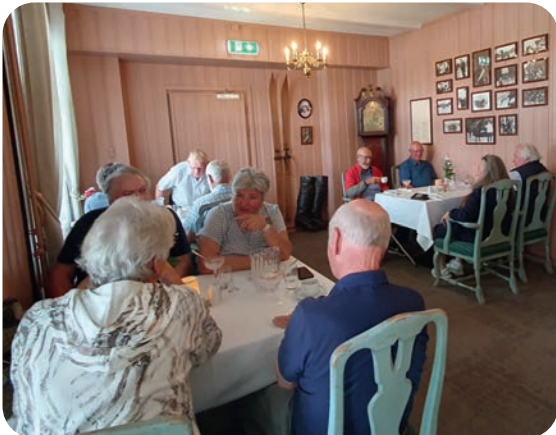
Noen av deltakerne ved lunsjsserveringen