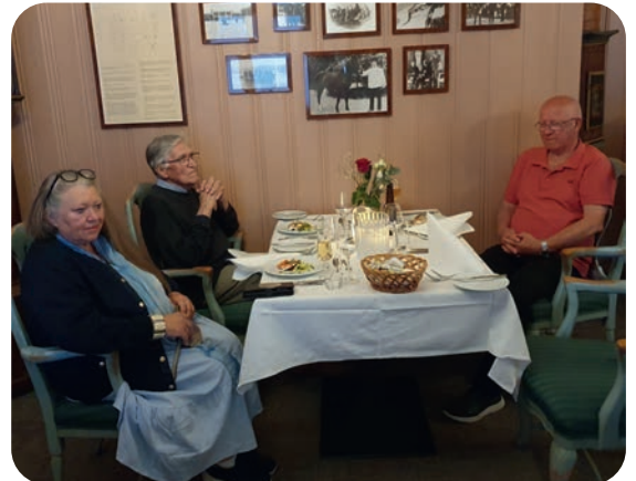
Repr. fra Hallingdal og Ringerike