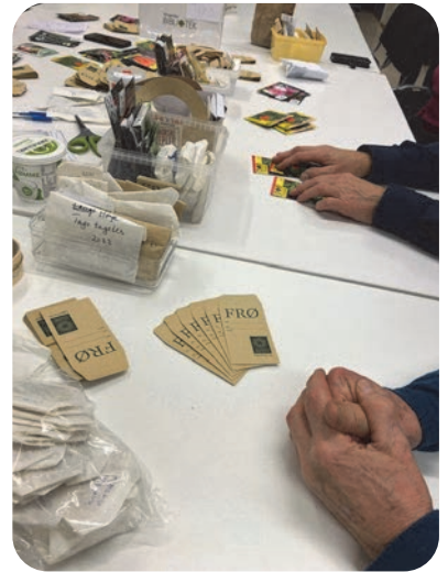
Pakking av frø i poser til årets Frøbibliotek.

Avslutningsvis leste Wenche diktet «Hjerte i lyngen» fra