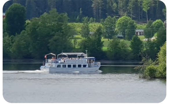
MS Kyllingen på tur på Krøderen