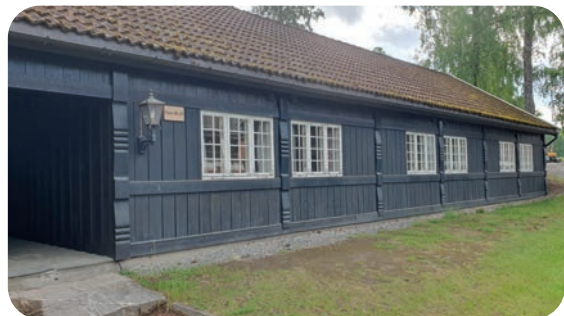
Enda flere bygninger